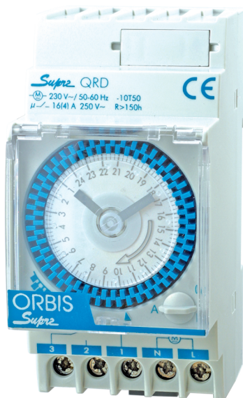
Модульное реле времени.