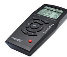
SendoPro 868-A, пульт инженера ↳ Артикул: 9070675 Подробнее см. стр. 293