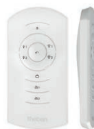
theSenda S, пользовательский пульт ↳ Артикул: 9070911 Подробнее см. стр. 295