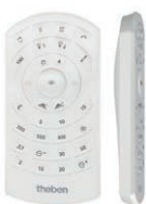
theSenda P, пульт сервисных служб ↳ Артикул: 9070910 Подробнее см. стр. 295